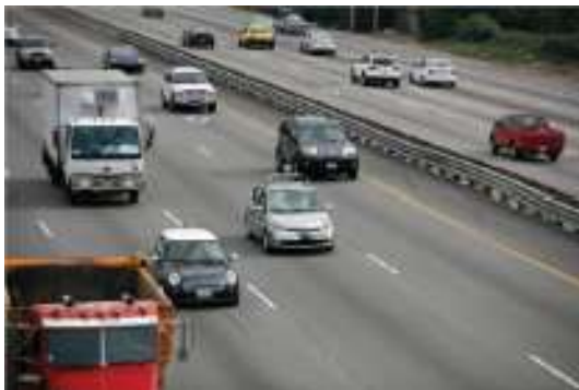
(أ) صورة اصلية

أساسي على الكشف عن الحواف واستخراج الميزات من المستند المشكوك به (على سبيل المثال، المستند في شكل صورة) (١) . علاوة على ذلك، تعد معلومات الحواف في الصورة واحدة من أهم البيانات التي يمكن أن تصف حدود الهدف وموقعه النسبي داخل المنطقة المستهدفة. يعد اكتشاف الحواف أحد أهم العمليات في معالجة الصور ويمكن اعتبارها أداة للكشف عن التزوير/التقليد. في هذا السياق تطورت اساليب الكشف بشكل مستمر من خلال تقنيات وخوارزميات مختلفة تعمل على الآلات والأجهزة.