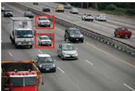
(ب) صورة مزورة